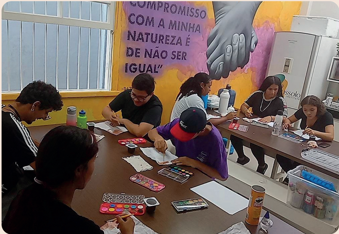
Aula de artes, 04/03/2024

algo que gostava muito na época. Esse momento me ajudou a vencer a timidez e a expressar meus interesses com mais confiança, habilidades que hoje são cruciais na minha formação. Também fiz amigos incríveis e conheci pessoas que me inspiraram, contribuindo para meu amadurecimento e para a construção de relações significativas.