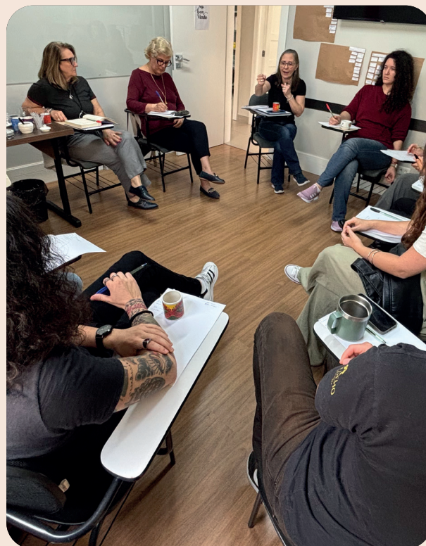
Reunião pedagógica, 15/10/2024