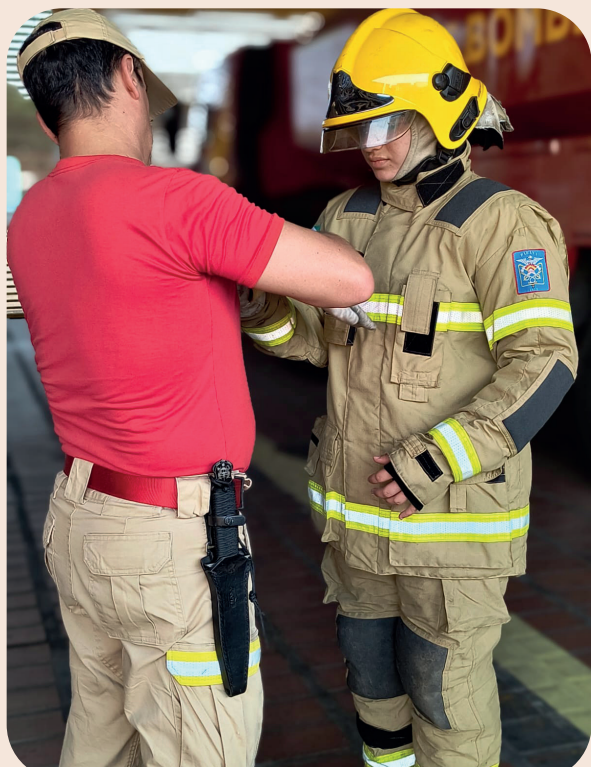
Visita ao Corpo de Bombeiros, 23/09/2024