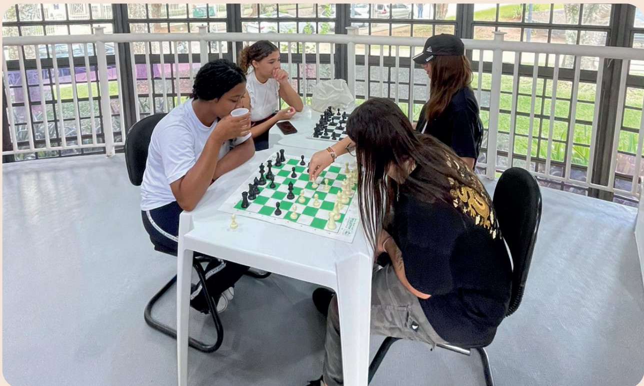
Xadrez no Farol do Saber Miguel de Cervantes, 05/04/2024

E é essa capacidade de se adaptar e inovar que faz do ILP um verdadeiro potencial de mudança de perspectiva de vida por meio do convívio, de rodas de conversa, de partilha de ensinamentos.