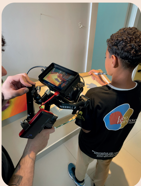
Instituto Leo Perussolo, 20/09/2024