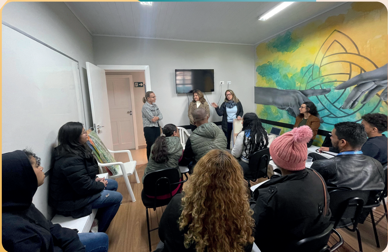
Encontro com as Famílias, 06/07/2024