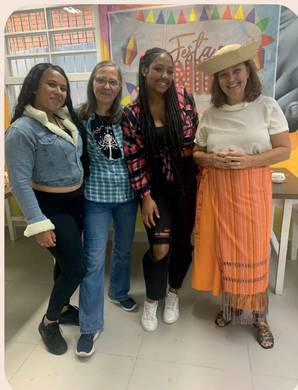
Festa Junina, 21/06/2024