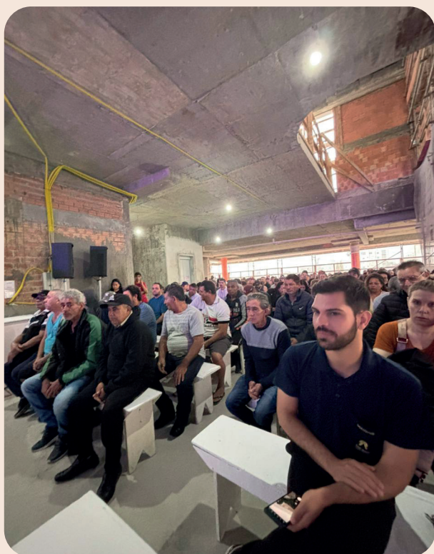
Apresentação SIPAT da Construtora San Remo, 04/10/2024 SIPAT

conscientes e responsáveis. A instituição tem foco nas áreas de educação, saúde e assistência social visando à promoção de uma transformação social para um mundo mais igualitário.